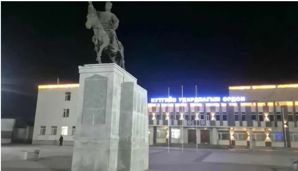
Tub talbai sukhbaatar square bugd