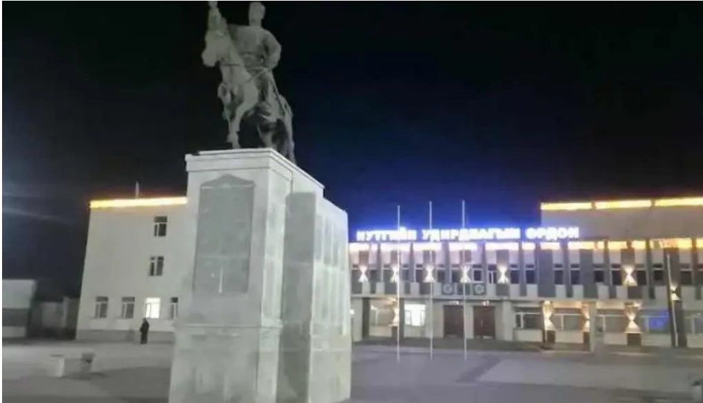
Tub talbai sukhbaatar square ??????????