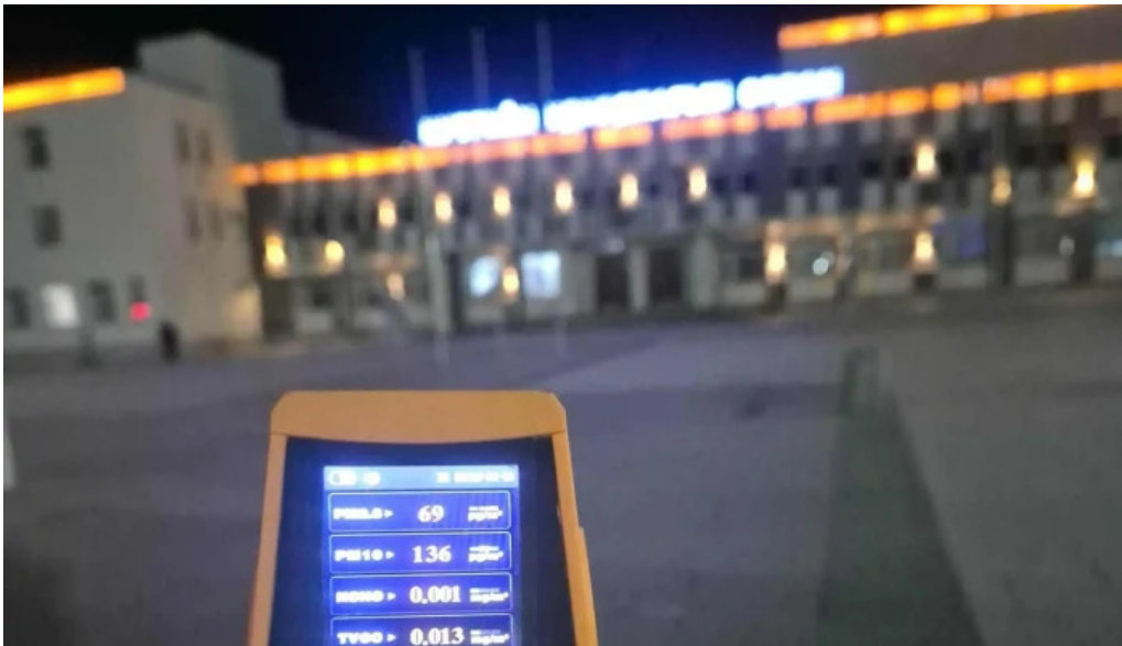
Tub talbai sukhbaatar square ?????? ????????