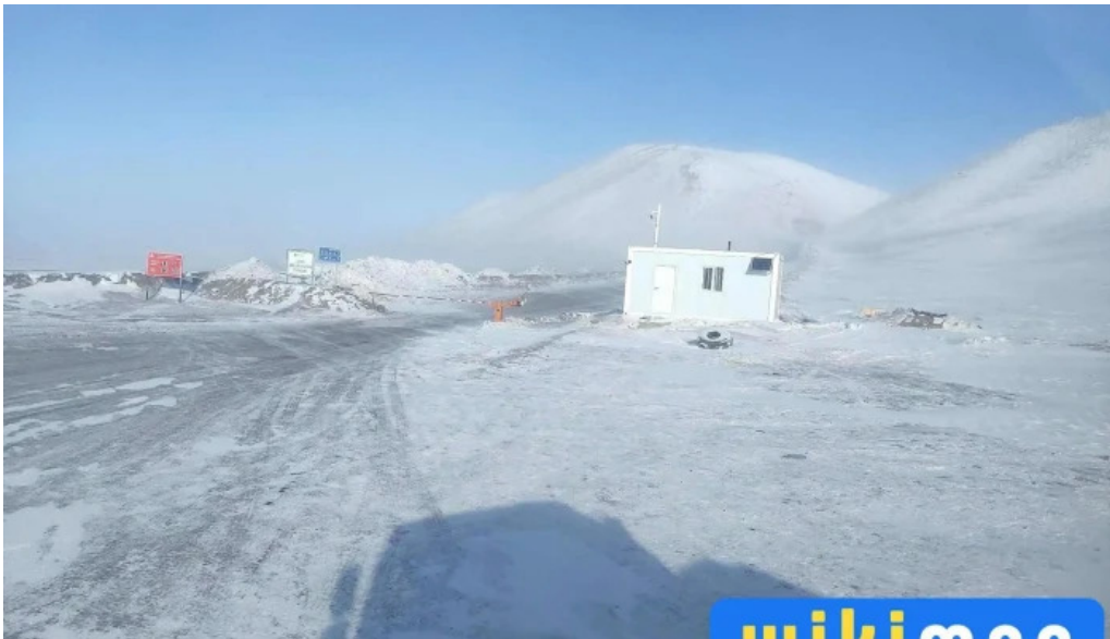
Zuun khoshoot bugd