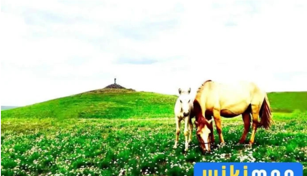
Baian erkhetiin ovoo bugd