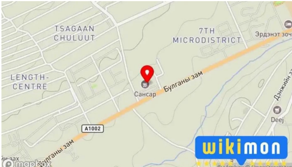
Erdenet sansar supermarket ?????? ??????