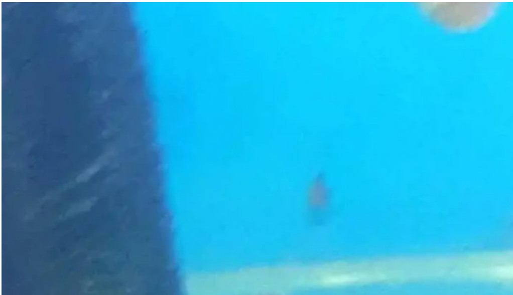
Erdenet sansar supermarket video