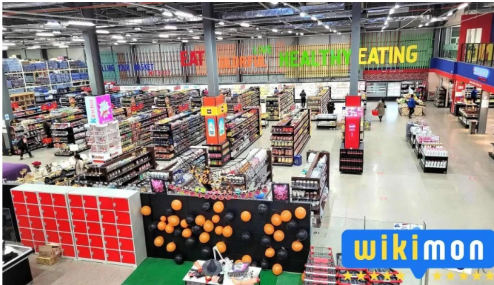
Erdenet sansar supermarket bugd