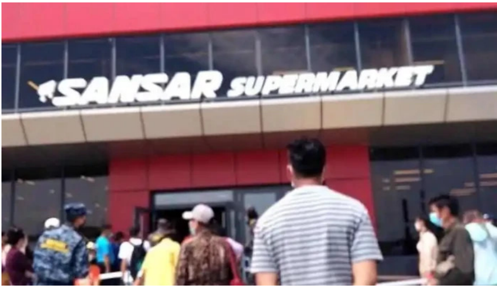
Erdenet sansar supermarket ???????