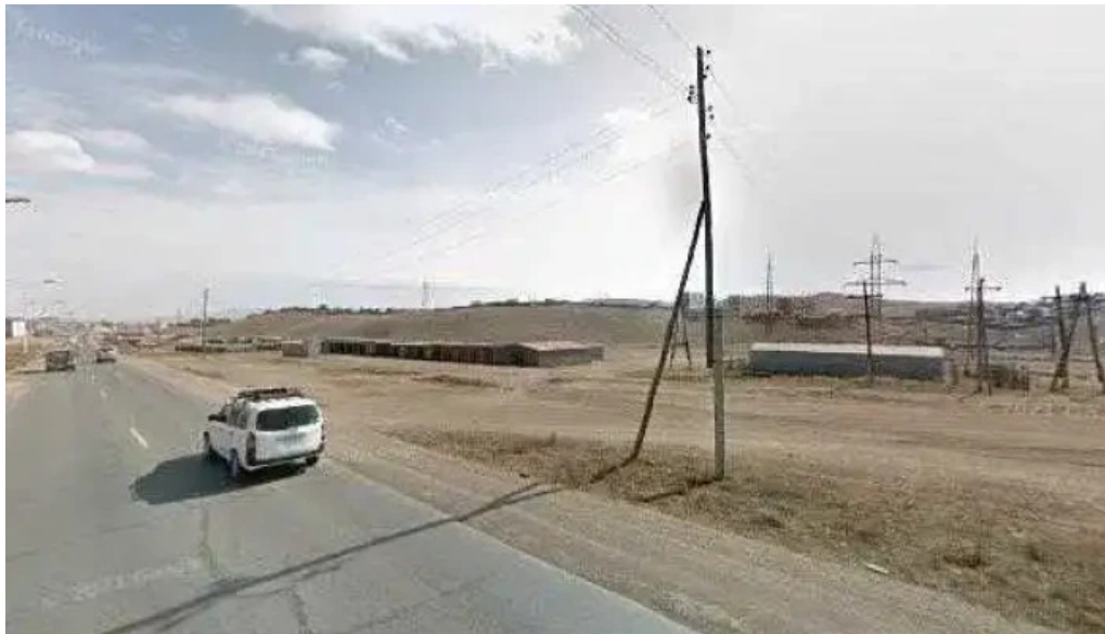
Erdenet sansar supermarket gudamzh kharakh bolon 360deg