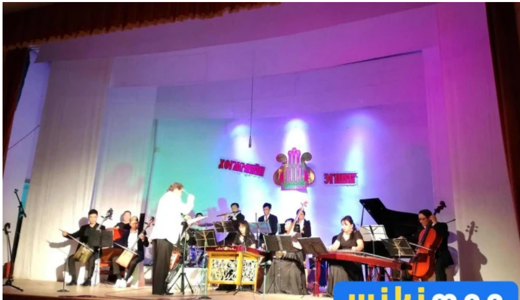
Borzhigon chuulga bugd