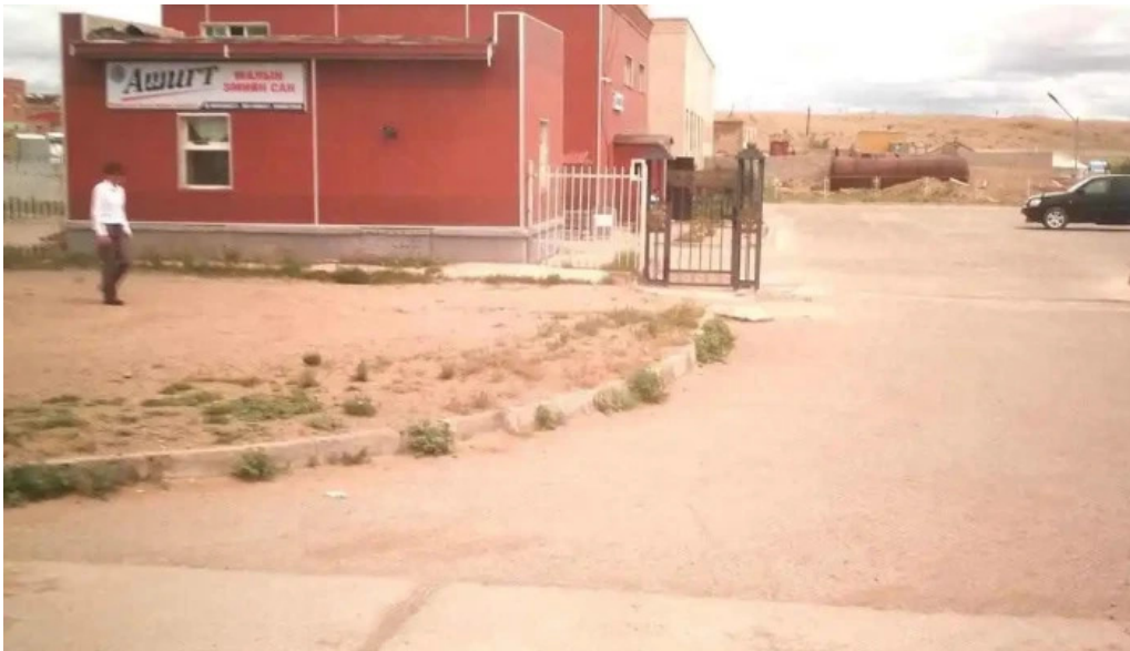
Dundgovi bus station bugd