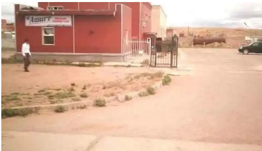
Dundgovi bus station ???????????