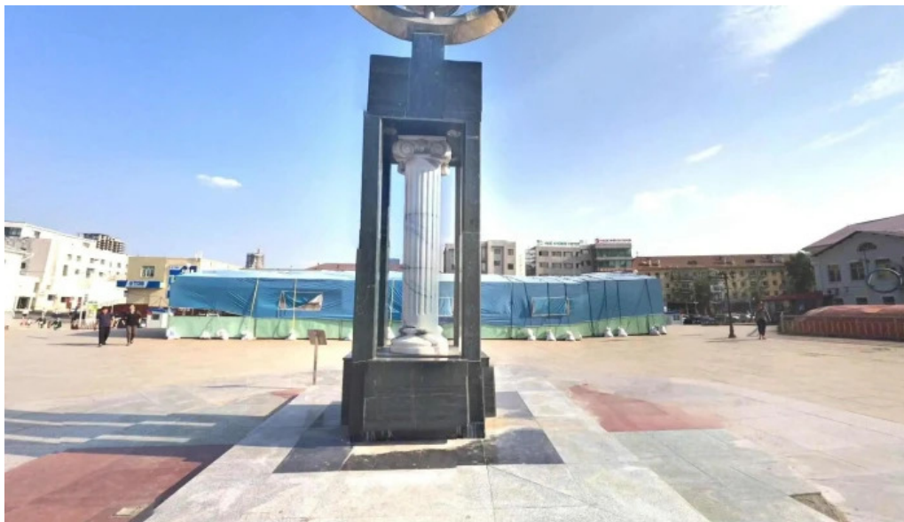
Khot baiguulalt barilga oron suutszhuulaltyn iaam bugd