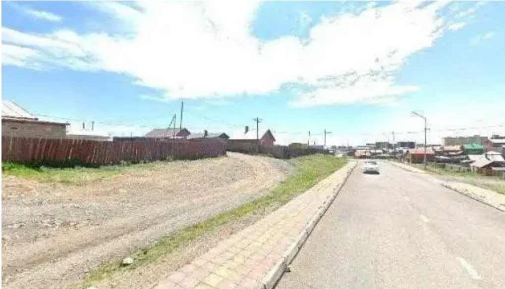
Arvaikheer gudamzh kharakh bolon 360