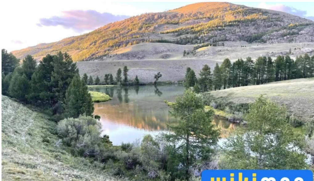
Nogoon nuur uul