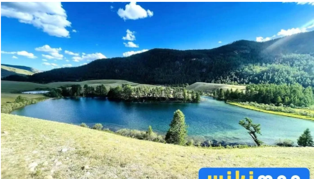
???????? ????? ????????