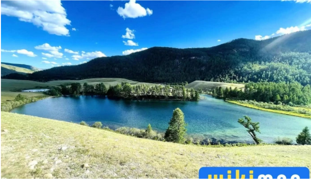
Nogoon nuur bugd