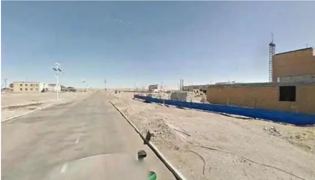
Ontsgoi baidlyn gazar bugd