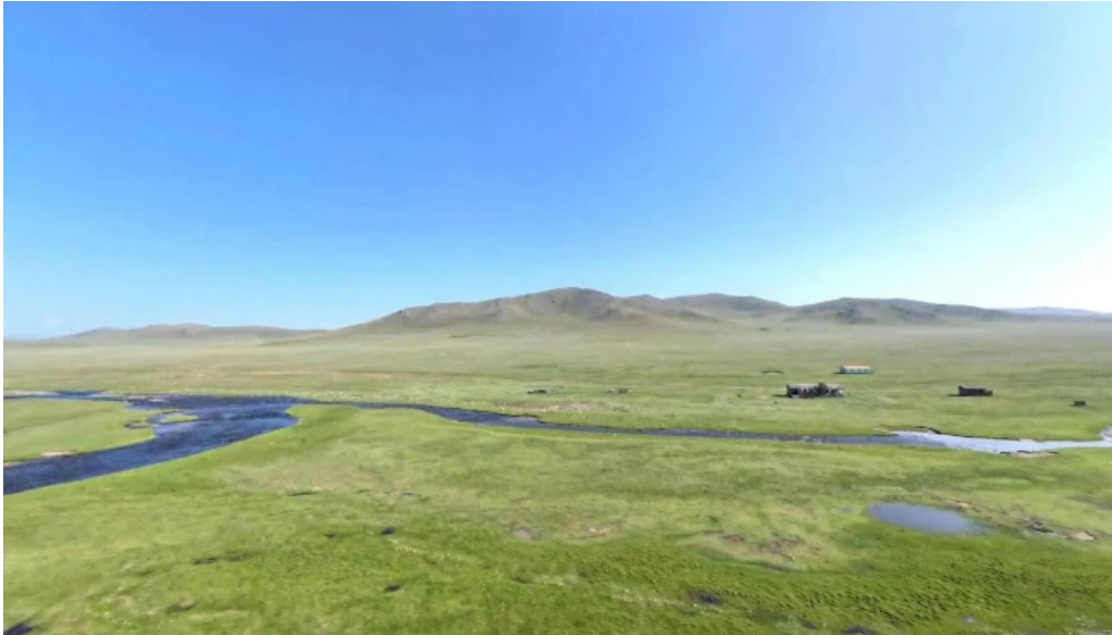
Zhargalant gudamzh kharakh bolon 360deg